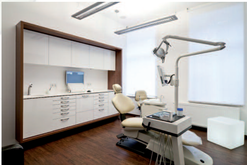
Abb. 6: Behandlungsbereich 3.